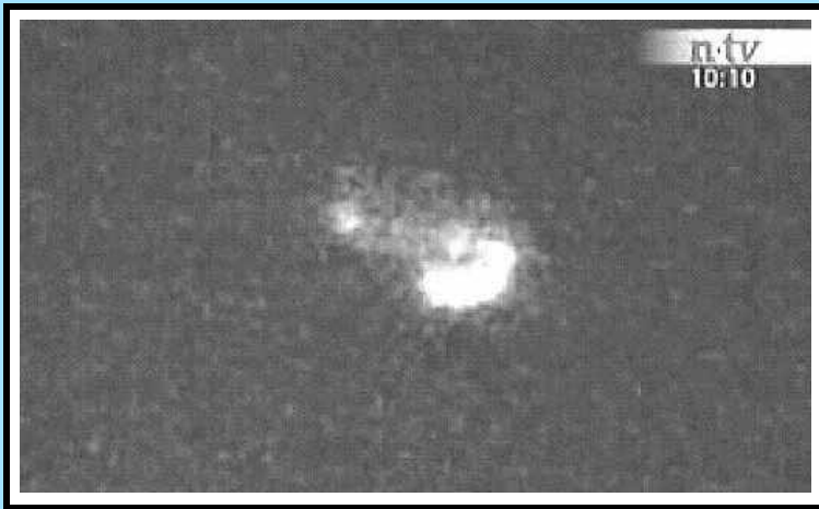
Bild: Angebliches UFO über Peru.

Centrales Erforschungsnetz Außergewöhnlicher Himmelsphänomene